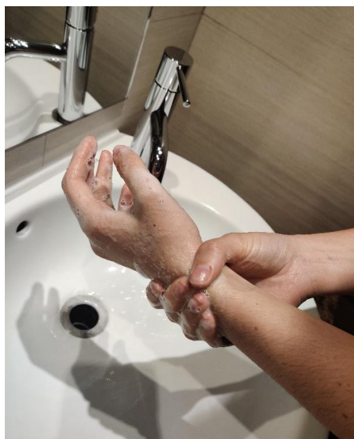
segueix rentant els canells.