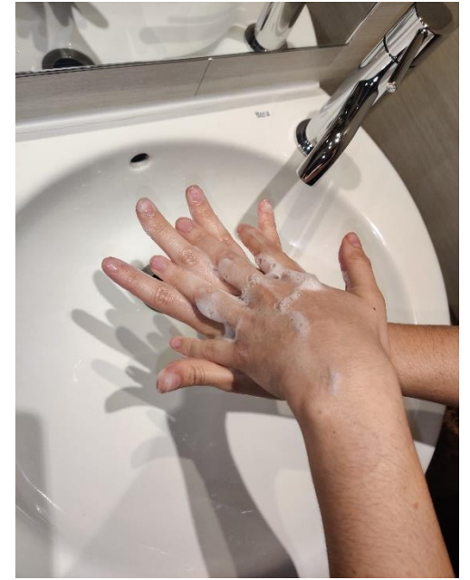
el palmell d'una mà envers el dors de l'altra, entrellaçant els dits i a l'inrevés,